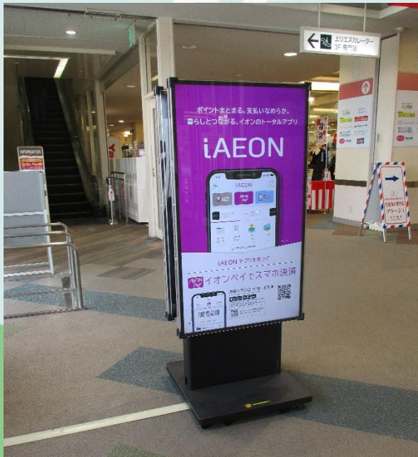
2階 駅側出入り口付近