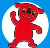
▲千葉県マスコットキャラクター チーバくん