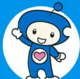
▲(公財)ちば県民保健予防財団 マスコットキャラクター けんじ