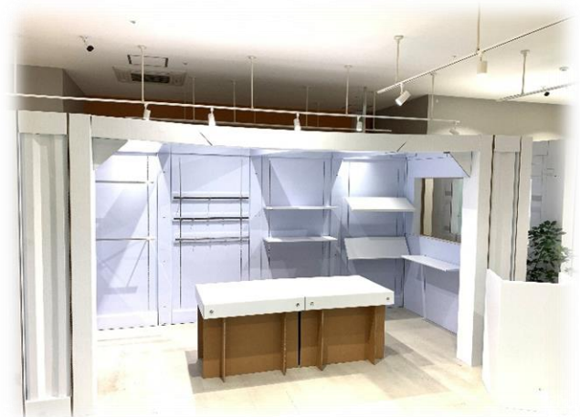
↑強化段ボール製当社オリジナルコンテナ