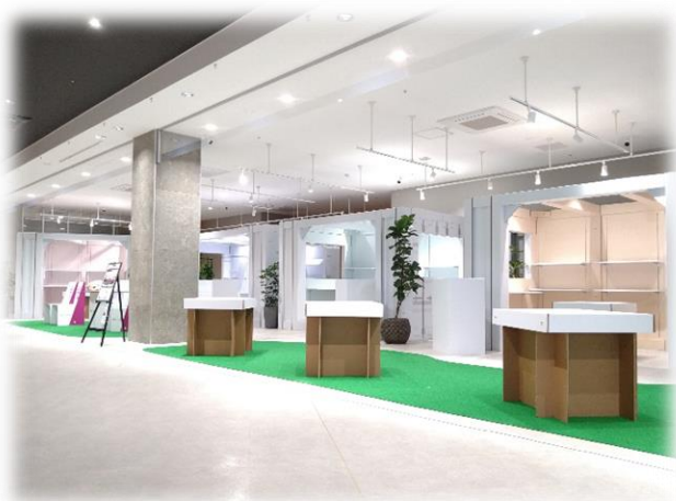
↑イオンタウン吉川美南 導入全体図

7月14日（金）より埼玉県吉川市のSC「イオンタウン吉川美南」に4台のコンテナを導入し、運用をスタート。順次他SCでの展開を予定しています。