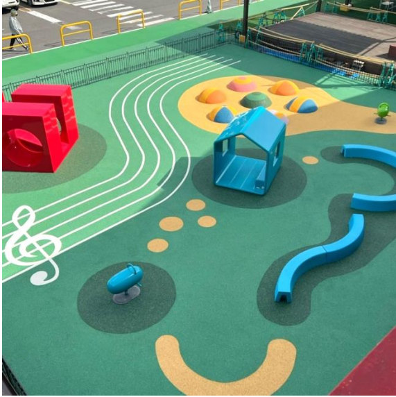
▲「音楽」のイメージを反映したデザイン