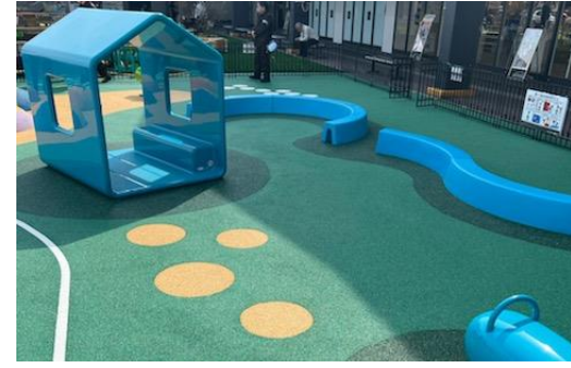
▲お子さまが安全に楽しく遊べる遊具を設置